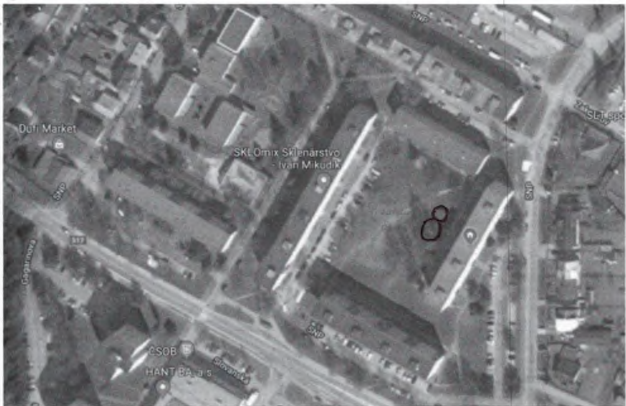
Príloha č.2: Predpokladaný dizajn prvkov mestského mobiliáru a zasadenie do areálu